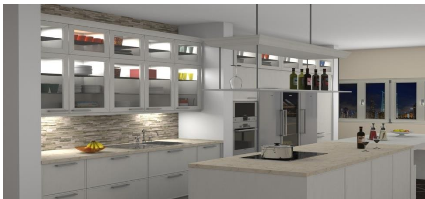
Obr. 1 Wizualizacja w nowej grafice 3D – funkcja Raytracer

Szczegółowe, zalecane wymagania sprzętowe nowej grafiki CARAT znajdują się na naszych stronach internetowych w sekcji Wymagania HW .