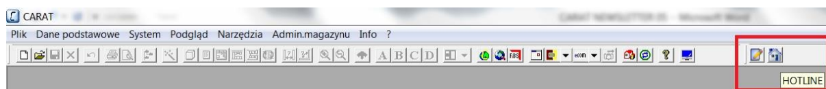
Obr. 2: Dodatkowe przyciski w panelu narzędzi

Z prawej strony panelu narzędzi widoczne są dodatkowe przyciski - obrazek 2.