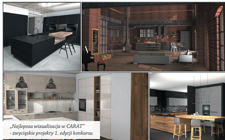
„Najlepsza wizualizacja w CARAT” - zwycięskie projekty 1. edycji konkursu

„Program Carat pozwala na tworzenie wyjątkowych wizualizacji wnętrz Verle. Są to projekty, które powstają sprawnie i szybko. Intuicyjna praca z programem stwarza nieograniczone możliwości dla doświadczonego Projektanta. Wariant wprowadzania własnych tekstur, świetnie zaopatrzone biblioteki, profesjonalna obsługa i pomoc ze strony biura sprawiają, że projektanci studiów Verle chętnie z niego korzystają. Zdecydowanie polecamy program CARAT.”